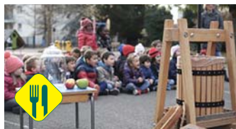
Fabrication de jus de pommes