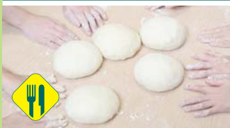
Du blé au pain