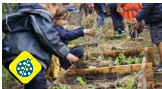
Opération potager et compost