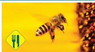
Le miel et les abeilles

J'ai créé l' ATELIER DES SAISONS pour que les enfants puissent apprendre dans leurs écoles à jardiner et à cuisiner au rythme des saisons. En 2017/2018, 17 établissements scolaires ont fait appel à nos services et ont permis à 5000 enfants de participer à nos ateliers. N'hésitez pas à nous contacter pour l'année 2018-2019, afin que nous construisions avec vous un projet pour votre école.