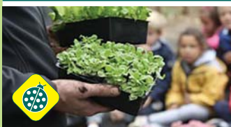
Des légumes au potager